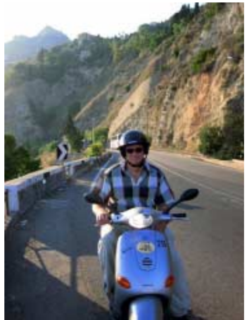
Sightseeing via Scooter