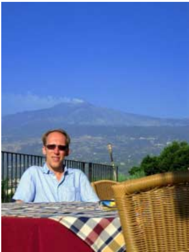
Frühstück im Agriturismo

Am nächsten Tag erkunden wir Taormina und die Gegend weiter südlich mit dem Motorroller. Die antike Arena ist eine der Hauptattraktionen Taorminas. Die vulkanische Landschaft Siziliens tritt an den verschiedenen Küstenabschnitten gut zu Tage: während die Sandstrände zwischen