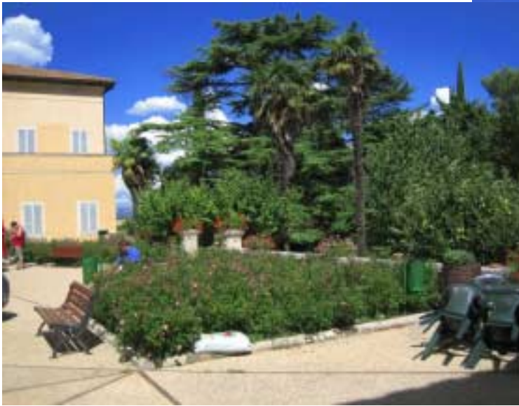
Übernachtung in einer Pilgerpension