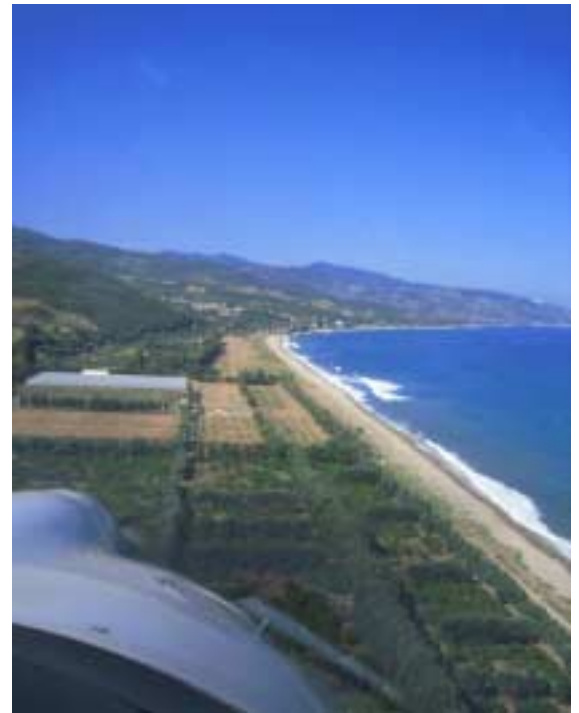
Anflug auf Caronia