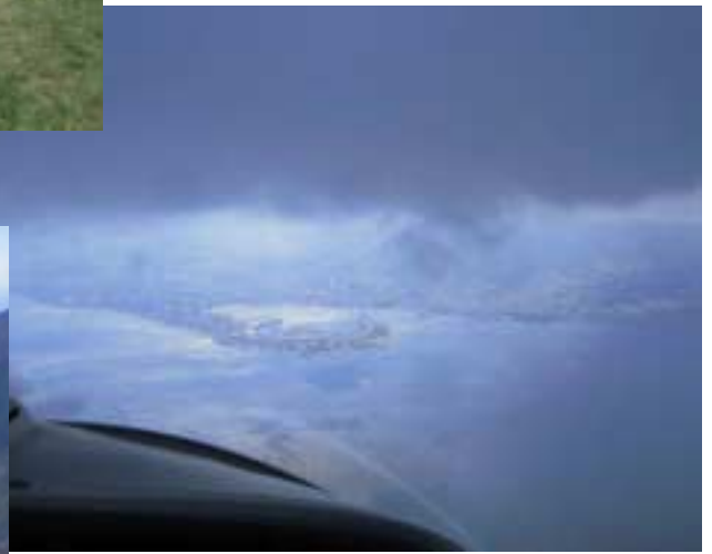
Straße von Messina

folgen der Ostküste nach Süden. Aufgrund der vorherrschenden Nordostlage ist es turbulent. Als wir den Touristenort Taormina überfliegen, machen wir uns bereit