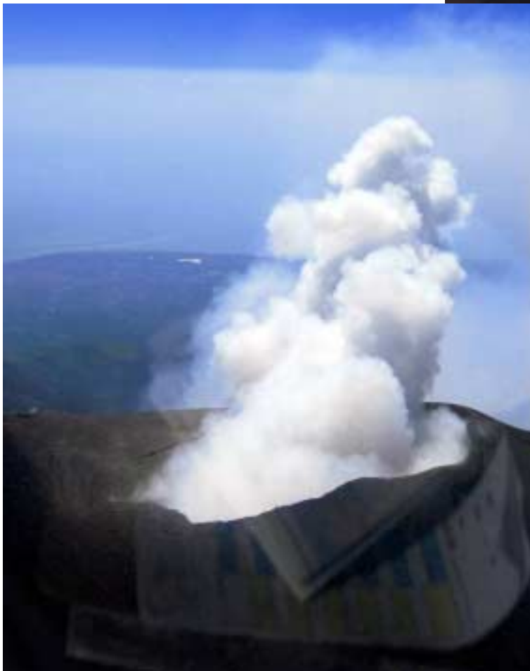
Schau mal wie der raucht

nutzen wir in Segelfliegermanier den Hangaufwind und steigen auf über 12.000 Fuß an den Kraterrand, jedoch stets in einem respektvollen Abstand. Die Spuren der letzten Eruption sind trotz Qualm noch zu sehen. Dies ist wohl eine andere Art der Besichtigung im Vergleich zu den sonst üblichen geführten Touren auf der Autostraße. Nach einem rasanten Abstieg um wieder unter 1500 Fuß über Grund zu kommen, geht es weiter durch das Landesinnere zum „Flugplatz“ Eremo bei Ragusa, einem exklusiven Privatplatz (hier stimmt die Angabe im Avioportolano). Es stellt sich heraus, dass der Platz nur zur Übernachtung (Chalet oder Burghotel) angefliegen werden darf. Dass wir eigentlich hier nicht nicht bleiben wollen, ruft einige Irritationen hervor, doch hier ist es uns zu