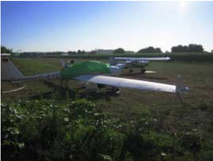
Nächster Tag - Startvorbereitungen in Modica