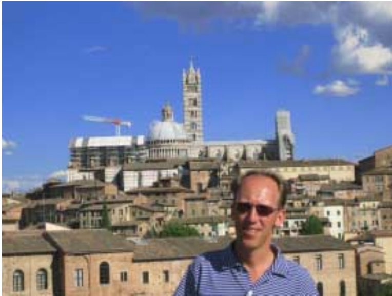
Sienas Skyline (mit Kran)

Der Transport nach Siena gestaltet sich schwieriger, da an diesem Nachmittag kein Scooter oder Auto mehr zu haben ist, und es auch keine öffentlichen Verkehrsmittel gibt. Also bleibt nur das Taxi, das uns dann auch abends gleich wieder zurückbringen darf.