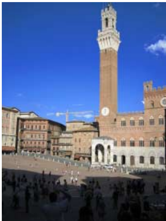
Siena, Piazza del Campo - diesmal ohne Palio, aber mit uns