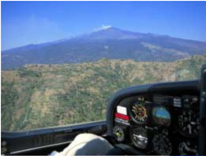
Ätnaflug – Steigen auf 12.000 ft