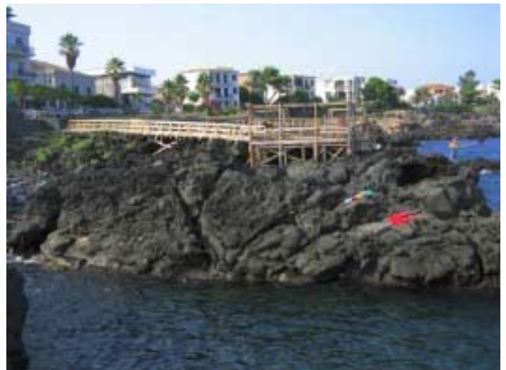
Lavaküste bei Stazzo

dunkelbraun und grau variieren, gibt es auch jüngere Stellen an denen man über erkaltete Basaltklippen ins Meer klettern muss. In der Augusthitze legen wir mehrere Badestopps ein. Das Abendessen nehmen wir auf der Terrasse des Agriturismo ein, nachdem die Sonne hinter dem Ätna untergegangen ist.