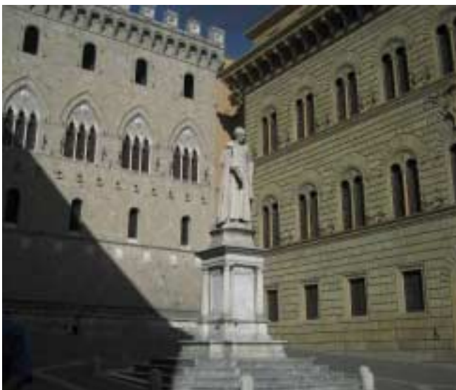
Stammhaus der Banca Monte dei Paschi di Siena, der ältesten Bank der Welt (seit 1472)