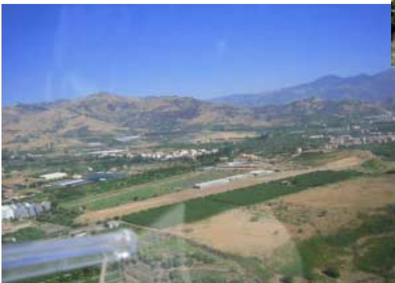
Calatabiano am Fuße des Ätna

zur Landung auf dem etwas südlicher gelegenen Platz Calatabiano. Auf das im Aerokurier beschriebene Lee gefasst, landen wir Richtung Norden ohne Probleme auf der 600m Piste. Wir verzurren die D-KYSI neben zwei P92 ULs. Direkt am Flugplatz liegt ein „Agriturismo“ Hotel. Von der Terrasse aus ist der Ätna prominent im Blick und praktisch liegt das Hotel auch, also beschließen wir die nächsten zwei Tage hier zu bleiben. Am Swimmingpool treffen wir die beiden Crews der ULs aus der Nähe