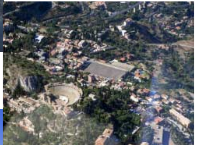
Teatro Greco - Taormina

zur Landung auf dem etwas südlicher gelegenen Platz Calatabiano. Auf das im Aerokurier beschriebene Lee gefasst, landen wir Richtung Norden ohne Probleme auf der 600m Piste. Wir verzurren die D-KYSI neben zwei P92 ULs. Direkt am Flugplatz liegt ein „Agriturismo“ Hotel. Von der Terrasse aus ist der Ätna prominent im Blick und praktisch liegt das Hotel auch, also beschließen wir die nächsten zwei Tage hier zu bleiben. Am Swimmingpool treffen wir die beiden Crews der ULs aus der Nähe