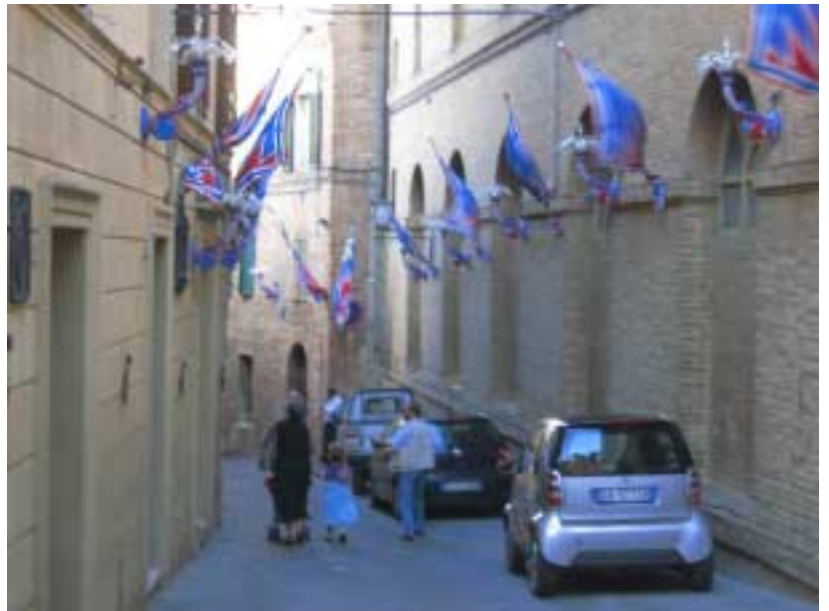
Die Farben der „Contrada della Pantera“

Den Tag beschließen wir mit einem ausführlichen Rundgang durch die Altstadt und einem ausgiebigen Essen ab.