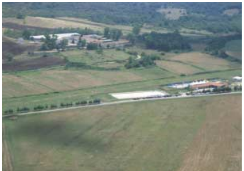
Airfield Pantano – Flugplatz mit Schwimmbad

Eigentlich hatten wir uns auf eine Runde im direkt an der Piste gelegenen Schwimmbad gefreut, doch nun kommt erst einmal die