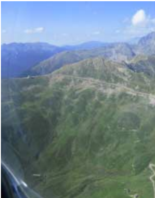
Ab Penser Joch - CAVOK

Fast schon traditionell verläuft der Start zwischen zwei Frontensystemen auf der Alpennordseite. Rechtzeitig am Sonntagmorgen ergibt sich ein Wetterfenster für den Sprung über den Brenner. Noch schnell den Flugplan aufgeben, dann geht es bei niedriger Bewölkung durch das Inntal zum Brenner. Im ansteigenden Gelände löst sich auch der restliche Stratus auf, und ab Sterzing ist alles CAVOK.