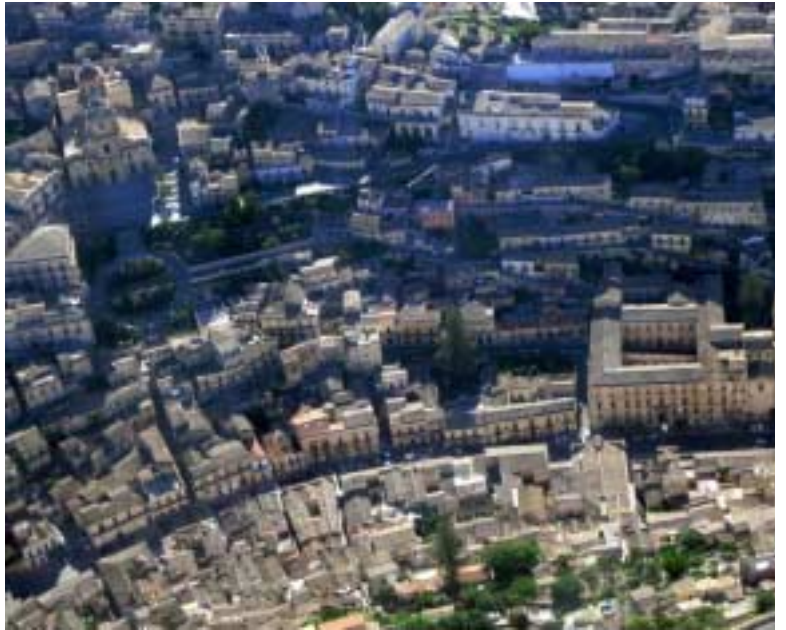
Der Canyon von Modica