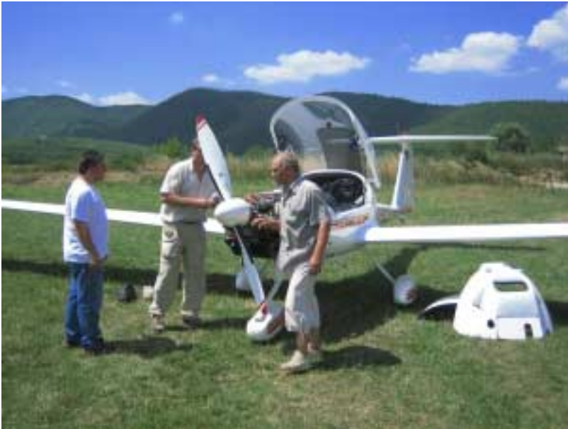
Motorcheck mal zwischendurch

UL-Tankwagen' bestehend aus rollbarem Fass und elektrischer Pumpe. Nach dem Start geht es Richtung Lamezia und dann weiter an der Westküste entlang. Es ist erstaunlich wie hoch die Berge an der Westküste Kalabriens noch sind. Dadurch wird auch der Funkkontakt zu Landeplätzen deutlich eingeschränkt, teilweise bekommt man erst unmittelbar an der Grenze zu Kontrollzonen Kontakt. Über der Strasse von Messina sinkt die Basis auf unter 3000 Fuß ab, und dann ist Sizilien in Sicht. Wir kreuzen die Meerenge nach Messina Stadt und