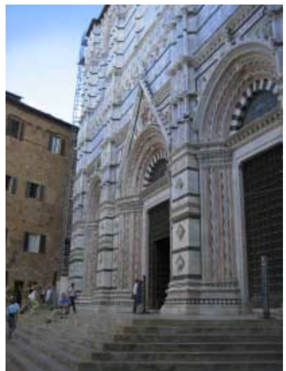
Domportal aus Marmor