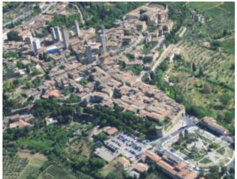
San Gimignano aus der Luft

Der Weg nach Unterwössen ist nur noch reine Formsache, und nach etwas mehr als 1 h Flugzeit landen wir am Platz.