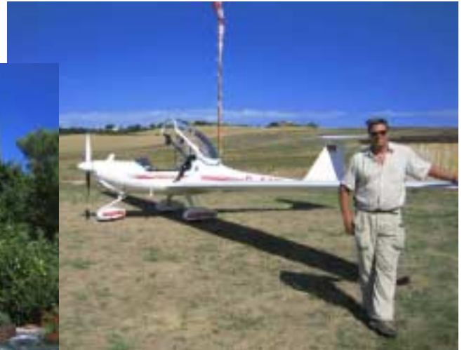
„Startklar“ in Siena