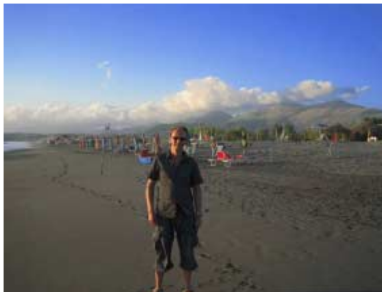
Abendstimmung am Strand von Scalea