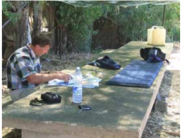
Der Tisch ist ja groß genug zum planen, die Karte nicht

Scalea mit seiner ca. 2 km langen Asphaltbahn ist erst seit vier Wochen provisorisch geöffnet – den alten UL-Platz gibt es nicht mehr – und wird