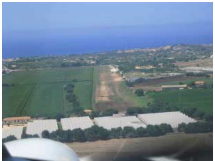
Unser südlichster Punkt – Marina di Modica

Unsere italienischen Gastgeber machen einen Stadtrundgang mit uns, und nach Focaccia und Bier bringen sie uns zurück zum Flugplatz. Unser Italienisch reicht mittlerweile für einen ganzen Abend.