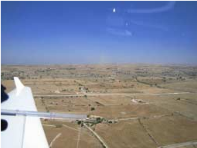
Privates Airfield Eremo bei Ragusa

abgelegen. Unsere Absicht nur zu tanken geht aber in Ordnung – für 25 EUR Landegebühr. Kurze Zeit später heben wir gegen den böigen Seewind wieder ab. Hinter dem Bahndamm ist die schwarze Stelle an der Einfassungsmauer noch gut zu erkennen, an der vor einigen Wochen eine Mooney beim Durchstarten verunglückt ist. Nach ca. 15 min, und einer extra Platzrunde um den heftigen Seewind zu checken, landen wir auf der kleinen Graspiste in Marina di Modica an der Südküste Siziliens. Wir hatten Rafaele vom örtlichen Aeroclub telefonisch „vorgewarnt“ und er kommt nach einem kurzen Anruf zum Platz. Auch er spricht kein Englisch, also muss wieder unser Italienisch reichen. Netterweise dürfen wir auf dem umzäunten Gelände unser Zelt aufschlagen und die sanitären Anlagen im