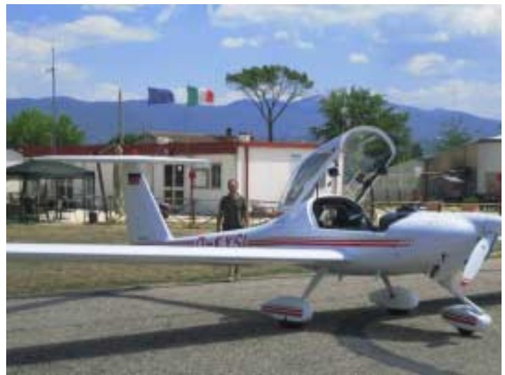
In Terni vor verschlossenen Toren