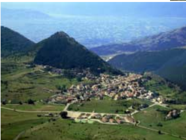
Ski Ressort in den Abruzzen

Cowling herunter. Unter den interessierten Blicken der italienischen Fliegerkollegen, welche ihre Erfahrungen mit dem UL Rotax maßgeblich in der P92 Echo haben, schauen wir uns die wichtigsten Punkte an. Unser Rotax 912 zeigt schon seit einigen Monaten einen leichten Ölaustritt dessen Ursache nicht ganz klar ist, zudem sind die Kerzen bei einem Zylinder deutlich dunkler als die anderen. Wir inspizieren die wichtigsten Punkte, können aber nichts feststellen. (Der Motor lief dann störungsfrei für den Rest der Reise).