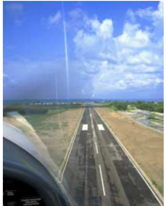
Take-Off auf der neuen Bahn in Scalea