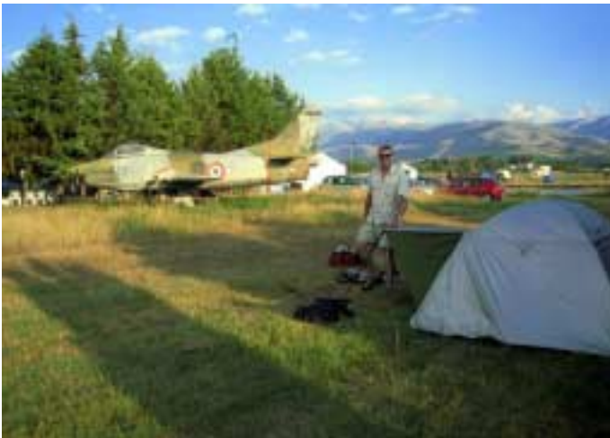
Nachtlager beim Jet in L'Aquila

Wochenende ist Flugplatzfest, damit ist das Abendessen aus Lammspießchen und lokalem Weißwein gesichert. Nur Tanken geht heute leider nicht mehr.