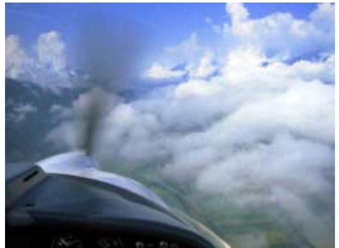
Mit 1500 Fuß durch die CTR Innsbruck

Als Zwischenlandung hatten wir uns Carpi bei Modena ausgesucht. Eigentlich ein schöner Platz mit langer Asphaltbahn, wenn nur der Turm auch Englisch könnte. So muss halt unser Italienisch herhalten, und wir werden nach der Landung nett mit „Green Fuel“ (Autobenzin) versorgt. Dann geht es weiter die Appeninen entlang, via Maranello (Ferrari Werk und Teststrecke ) nach Bagno, und weiter über Perugia nach Terni. Laut Avioportolano hat Terni eine Betriebszeit „Tutti i Giorni“ – also immer. Doch nach der Landung die große Überraschung: trotz Flugschule am Platz ist an diesem Sonntag kein Betrieb, auch telefonisch ist niemand zu erreichen – vielleicht sind Betriebsferien?