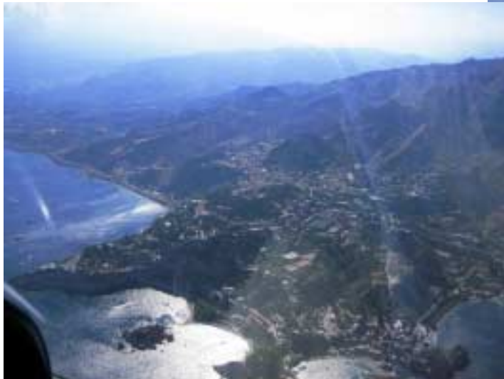
Alle wollen nach Taormina – wir auch

UL-Tankwagen' bestehend aus rollbarem Fass und elektrischer Pumpe. Nach dem Start geht es Richtung Lamezia und dann weiter an der Westküste entlang. Es ist erstaunlich wie hoch die Berge an der Westküste Kalabriens noch sind. Dadurch wird auch der Funkkontakt zu Landeplätzen deutlich eingeschränkt, teilweise bekommt man erst unmittelbar an der Grenze zu Kontrollzonen Kontakt. Über der Strasse von Messina sinkt die Basis auf unter 3000 Fuß ab, und dann ist Sizilien in Sicht. Wir kreuzen die Meerenge nach Messina Stadt und